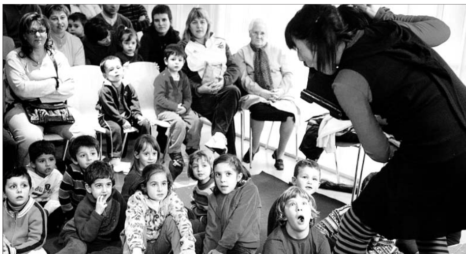
El grupo Chispandora, durante una actuación en San Gregorio, ayer.

En el centro cívico de Garrapinillos, los títeres de Arbolé representarán una de sus obras y, como siempre, intentarán que niños y adultos se sientan fascinados por estos espectáculos que quieren divertir a toda la familia.