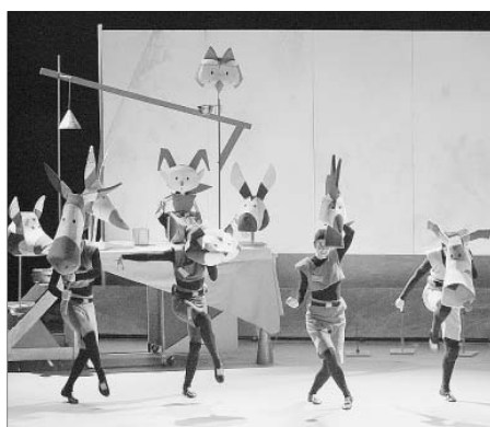
Los músicos de Bremen bailan sobre el escenario.

La fábula de la raposa: Teatro del Mercado. 18 y 20 h. 7 euros en taquilla, www.cai.es y cajeros CAL.